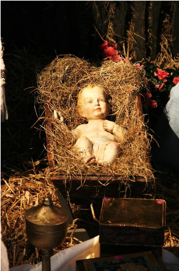
Text: Thorsten Seipel, In: Pfarrbriefservice.de