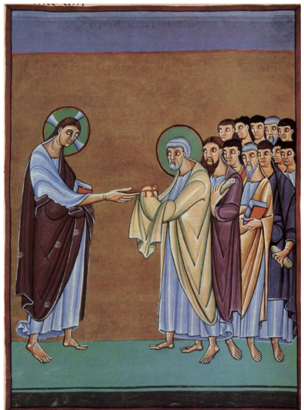
Bild: Der Heilige Petrus empfängt die Schlüssel, Buchmalerei, 11. Jahrhundert; Bayrische Staatsbibliothek München