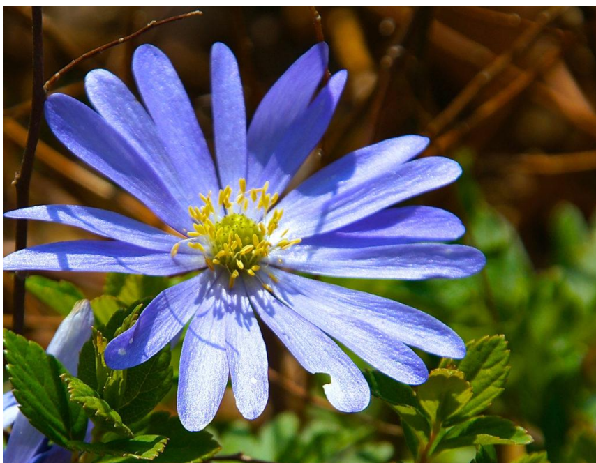
H. Harms © GemeindebriefDruckerei.de