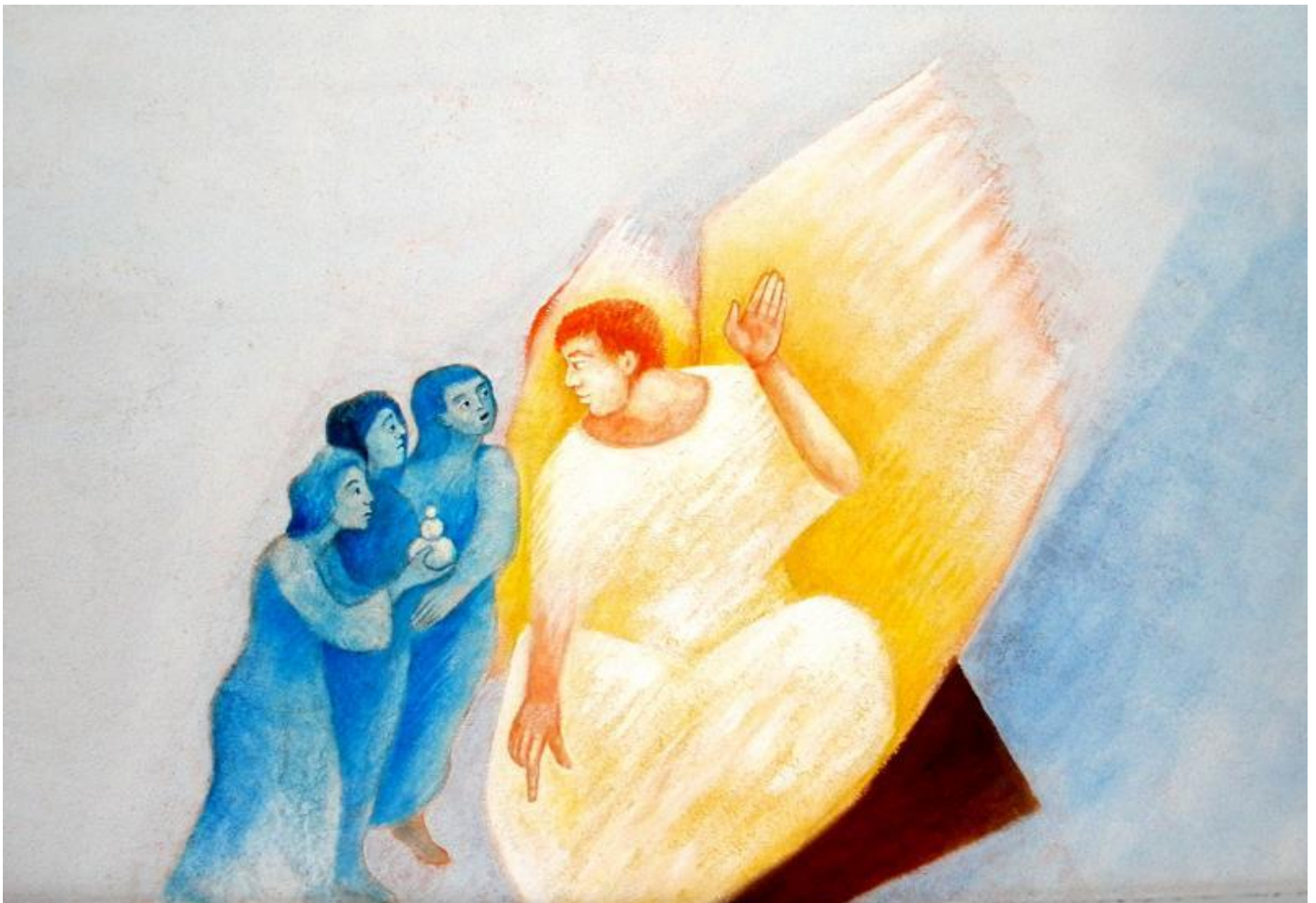
Bild: Foto: Friedbert Simon / Künstler: Polykarp Ühlein In: Pfarrbriefservice.de