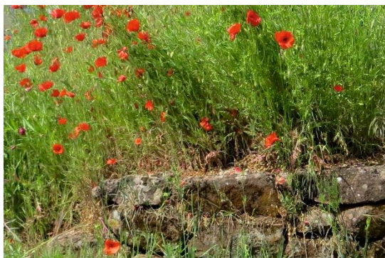
(gesehen am Pater-Ingbert-Naab-Haus)

„Die ganze Natur ist eine Melodie, in der eine tiefe Harmonie verborgen ist“.