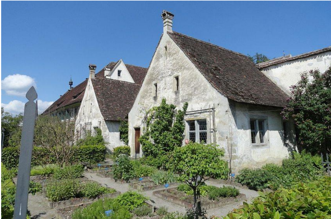
Kartause Ittingen am Bodensee

Was bewegte den angesehenen Gelehrten und Wissenschaftler Bruno von Köln (um 1030 bis 1101), sich mit einigen Gefährten in die völlige Einsamkeit zurückzuziehen und 1084 einen der strengsten Orden zu gründen?